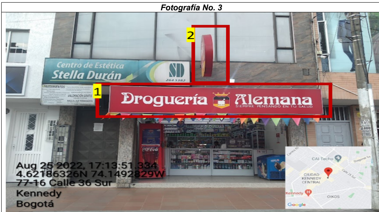
Fotografía No. 3