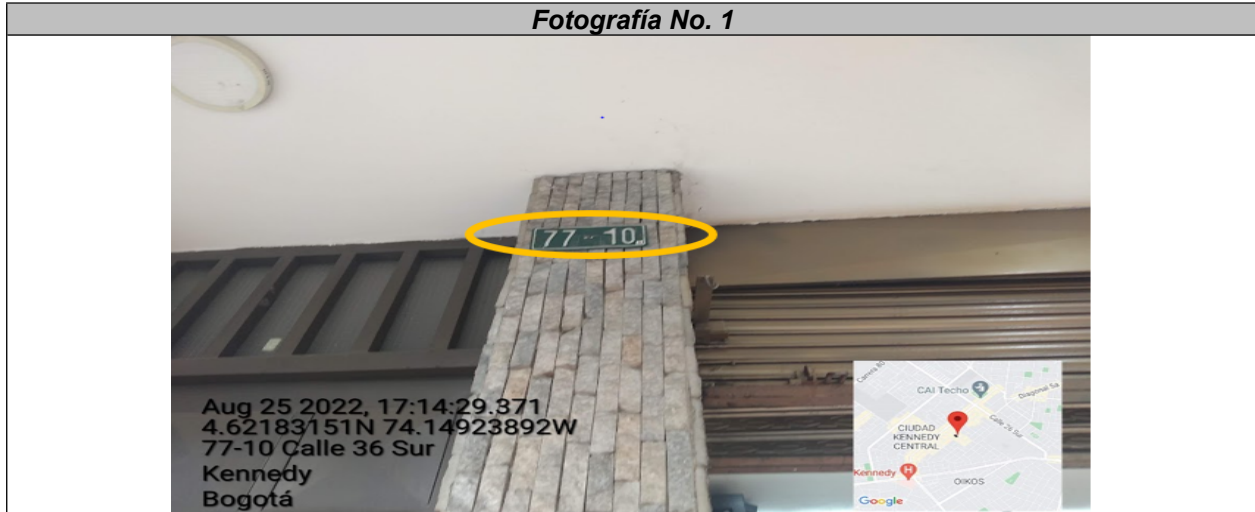
Nomenclatura del predio en el que se sitúa el establecimiento comercial denominado DROGUERÍA ALEMANA 345 , ubicado en la CL 36 SUR No. 77 – 10 .